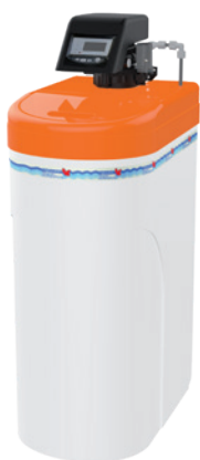
Modell JM 2 EF WZ-E