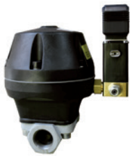
Automatische Abschlämmeinheit Modell JAE 20