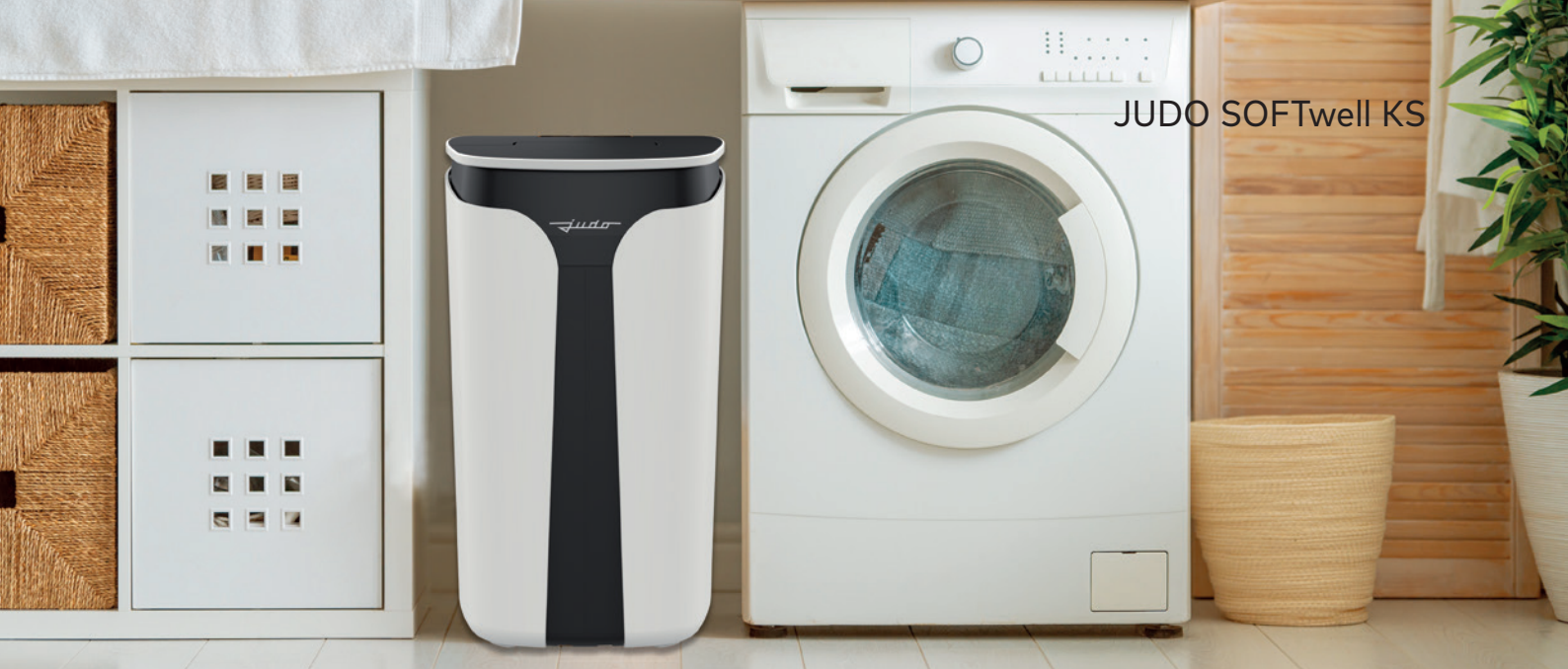
JUDO SOFTwell KS